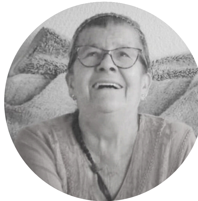
Abuela Naco Partera tradicional COLOMBIA