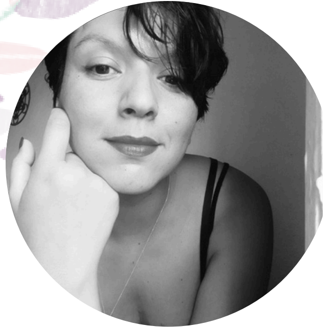
Estefania Flores Actriz